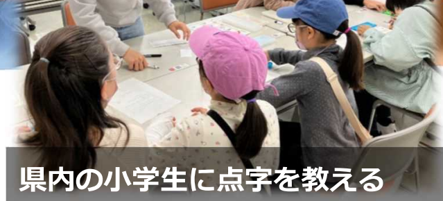
県内の小学生に点字を教える

今後も継続して、視覚支援学校のニーズに寄り添う教材開発と寄贈活動を行っていく予定です。工学部公認サークルでは熊本大学の学生が主に関わる形になりますが、将来的には同じ目的を持つ他団体とも協力し、より多くの方が開発に関わるような活動に広げていきたいと考えております。サークル活動を行った学生の卒業後も、SDGsに関する視点を忘れずに、エンジニアとして活躍していきたいです。またこの教材で支援を受けた視覚障害をもつ方が熊本大学に進学し、このような開発に積極的に関わられることを期待しています。