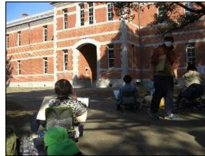
天気にも恵まれ、五高記念館前でスケッチ