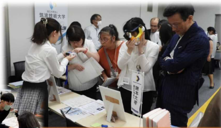
学会の場で機器展示を行う