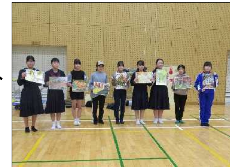
最優秀作品(美連賞)1点、 優秀作品8点を表彰