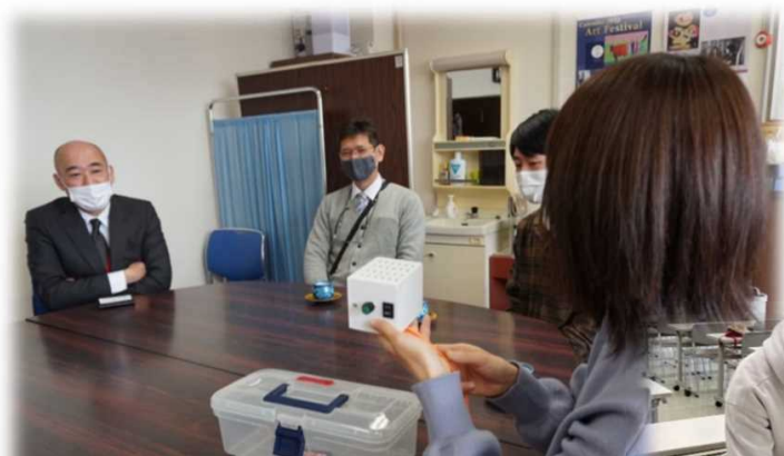
盲学校教員と開発会議をする