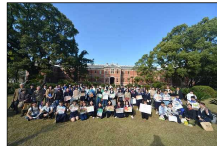
熊本市内、近郊の中学校等 から、71名が参加