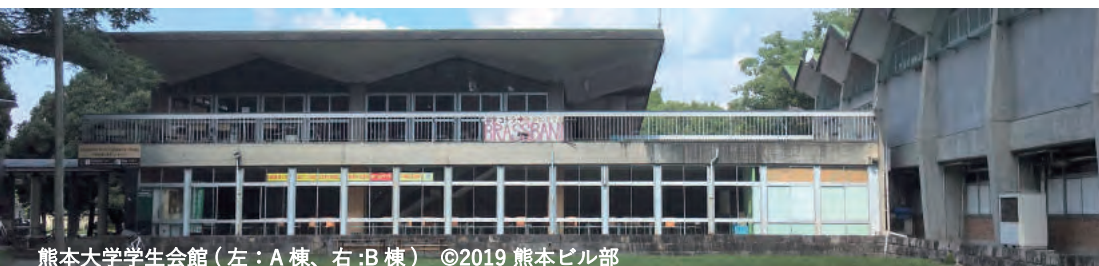
熊本大学学生会館（左：A棟、右：B棟） ©2019 熊本ビル部

<アクセス> 熊本駅から産交バス：楠畑地 / 竜田口駅前 / 光の森産交行き等、または「桜町バスターミナル」経由「熊本大学前」にて下車