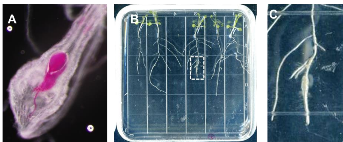
図 1. サツマイモネコブセンチュウとシロイヌナズナを用いた根瘤形成の解析システム。

○URL : https://www.science.org/doi/10.1126/sciadv.adf4803