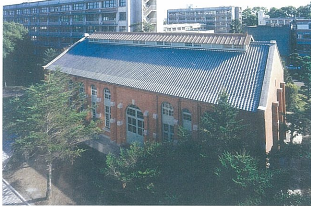
工学部研究資料館