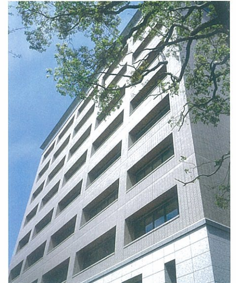
自然科学研究科・理学部研究棟