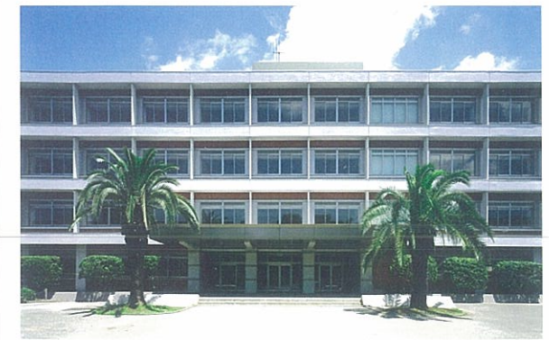
大教センター本館