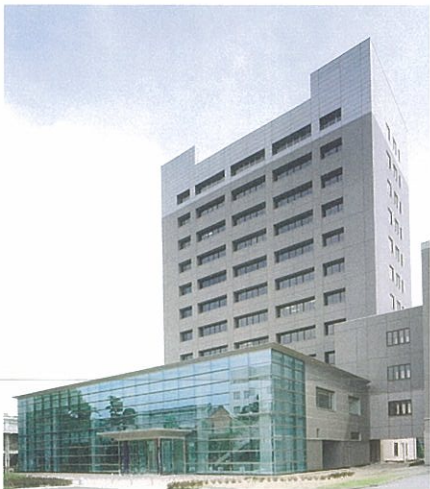
工学部百周年記念館