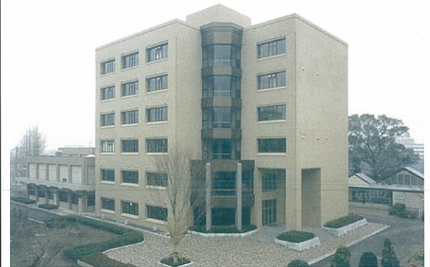
自然科学研究科研究棟