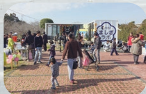
サテライトラボ「ましきラボ」 民間企業と連携して、地域の みなさんと楽しむイベントを開催