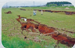
地表(地割れ)と地下水および 地下水状況の調査