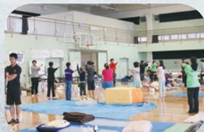
熊本大学黒髪避難所での体操