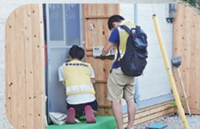
仮設住宅を1軒ずつ尋ねて 要望や課題の聞き取り調査を実施