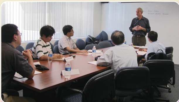
カリフォルニア州立大学フラトン校にて研修に参加する本学教員

今後は、本研修参加者が中核となって国際教育プログラムの充実に向けた活動を推進し、学部・大学院等の教育面において国際的な大学づくりが進むことが期待されます。