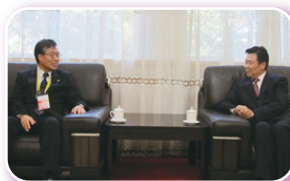
谷口学長と Xu Xianming 学長

10月14日、15日、谷口学長が中国の山東大学創立110周年記念式典及びInternational Exchange フェアに参加しました。初日の14日に開催された