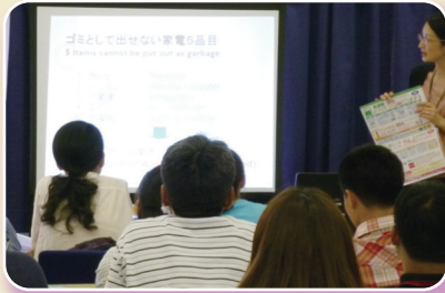
生活支援オリエンテーション