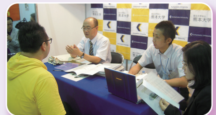
熊本大学ブースを訪れる韓国大学生

2010年度の本学サマープログラム参加者で今後、本学への進学を希望しているという学生もブースを来訪するなど、韓国からの留学生増加に向けて手応えが感じられました。