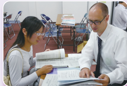
学生の質問に丁寧に答える本学教員

10月20日には東京外国語大学、11月4日には大阪大学において、国費(学部進学)留学生への進学説明を行います。