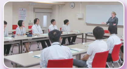
講師の説明を熱心に聞く参加者

研修初日の様子は、開始当初は緊張気味だった受講生も徐々に英語に慣れていき、授業の後半では、意欲的に質問や発表を行いました。半年間にわたる本研修の成果が大いに期待されます。