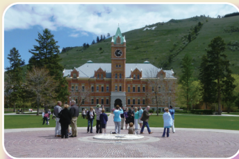
モンタナ大学キャンパス(メインホール前)

平成22年7月から約1年間、熊本大学の交流協定校であるアメリカ・モンタナ大学に交換教員として滞在しました。