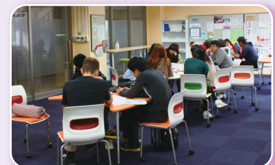
大きなガラス窓を持ち、明るい雰囲気交流室