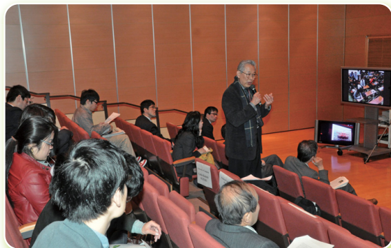
活発な議論を行う参加者。ワークショップの様子は、テレビ会議システム(右端)を利用して、岐阜大学にも配信された。

入やその問題点を考える上で大変参考になりました。優れた科学技術を持つ日本と豊富な天然資源を有するブラジルの二国間の協力関係の発展は、双方に利益と成果をもたらすものと期待しています。」と感想を述べました。