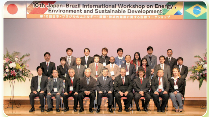
講演者及び関係者の記念写真

このワークショップは、日本及びブラジルの研究者が、エネルギー、バイオマス、環境、農業等の分野を中心に発表・議論を行うことによって連携を深め、両国の発展に寄与することを目的としており、ブラジルから6名、日本から5名の研究者が英語で講演を行い、活発な議論が交わされました。会場には、留学生を含む大学院生、研究者を中心に学内外から約140人の参加者が集まりました。また、ワークショップの様子はテレビ会議システムを通じて岐阜大学に配信され、大学院生26人が授業の一環として参加しました。