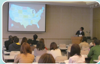
派遣学生の英語による発表

発表者からは写真やエピソードを交えつつ、留学中の体験、留学先大学の紹介、留学をとおして得られた成果等について報告が行われました。会場には、留学に興味のある学生や今後、留学を希望する学生など約40名の参加があり、留学経験者の発表が参加者にとって大いに参考になった、刺激になったとの声が聞かれました。