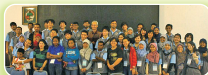
プログラム参加者

平成24年11月26日から12月4日まで「COMMUNITY AND TECHNOLOGICAL (CommTECH) CAMP-Highlight 2012」がITSで実施さ