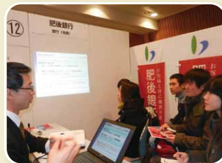
熱心に企業情報を収集する留学生たち