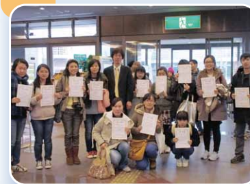
本講座修了生と鳥居副センター長

本講座は、熊本県内大学に在籍する留学生を対象とし、母国からの観光客が熊本を訪問した際などに熊本を案内するための知識を習得する目的で熊本留学生交流推進会議の主催(後援:大学コンソーシアム熊本)により開催されたものです。