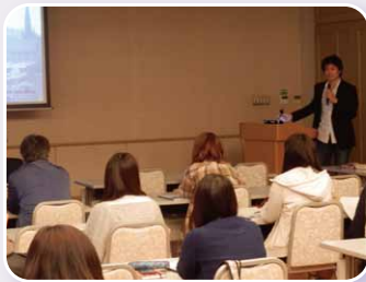
発表を行う留学経験者

発表者からは写真やエピソードを交えつつ、留学中の体験、留学を通して得られた成果等について報告が行われました。会場には今後、留学を希望する学生など約40名の参加があり、発表者への質問も相次ぎ、盛況のうちに幕を閉じました。参加者からは、「留学経験者の発表が大いに参考になった。」「刺激になった。」等の声が聞かれました。