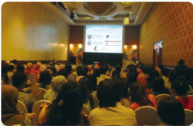
日本及びインドネシアの3大学の研究者が最新の研究を紹介

今回のフォーラム開催を通して、本学とインドネシアの大学との交流がより深まったことで、今後の留学生増や国際共同研究の一層の発展が期待されます。