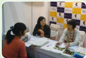
中国・上海会場(11月9-10日)

熊本大学に留学していた現地大学の学生や、現在、現地大学に留学中の熊本大学学生が熊本大学での生活などについて学生目線で説明を行いました。