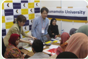
インドネシア・スラバヤ会場(10月26日)

上海では、本学ブースに70人を超える来場があり、学部や大学院、熊本の生活などについて質問がありました。また、以前、