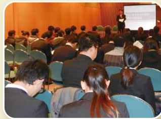
就職合同説明会の様子

今年で3回目となり、県内企業ほか16社、110人以上の留学生が参加しました。本学からもおよそ40人が参加しました。質疑応答も交えながら企業ブースでの説明に熱心に聞き入っていました。また、県内企業に就職した留学生の先輩とのパネルディスカッション、就職活動に当たっての面接のポイントについての講演もありました。